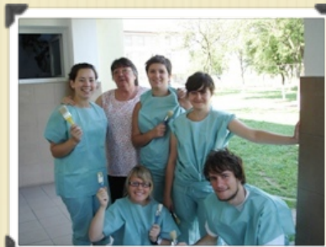
Joies de la vaisselle ou de la peinture !