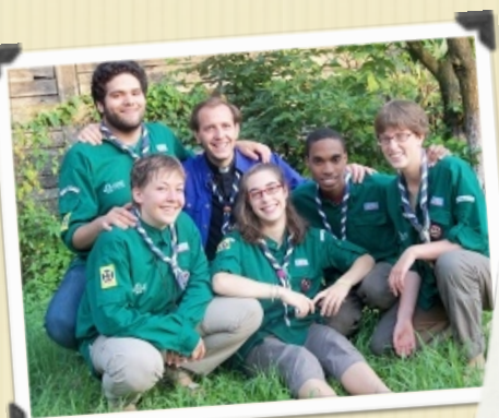
Des Compagnons heureux ...