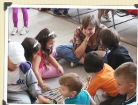
Bonheur auprès des enfants ...