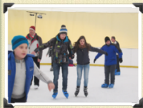
Joie des jeunes du centre de placement à la patinoire ...