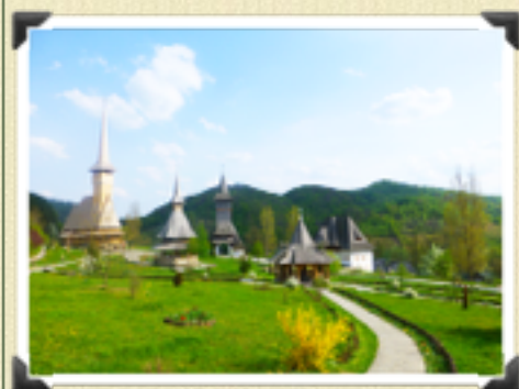
Et les joies du tourisme en Roumanie : ici un superbe monastère.