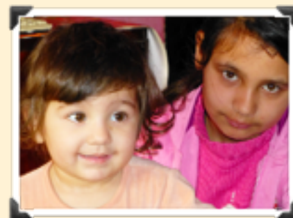
Deux de nos petits Roms parrainés.