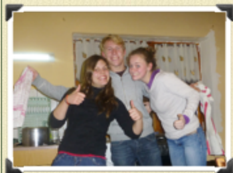
Les joies de la vaisselle ...